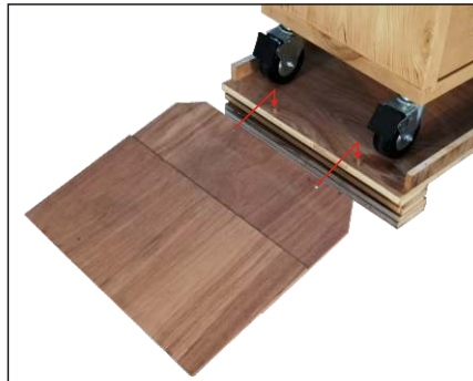
步驟2. 木斜板上有2孔洞對準木棧板側邊開口處的圓樺位置放入