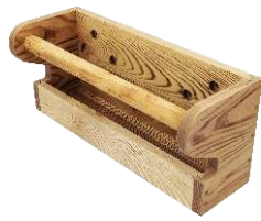
工具車側邊置物架x1個