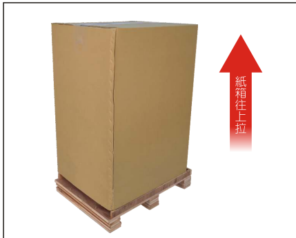
步驟1. 先將外部整體包裝往上拉移除