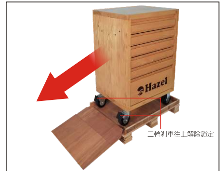
步驟3. 工具車主體從木斜板推至地面